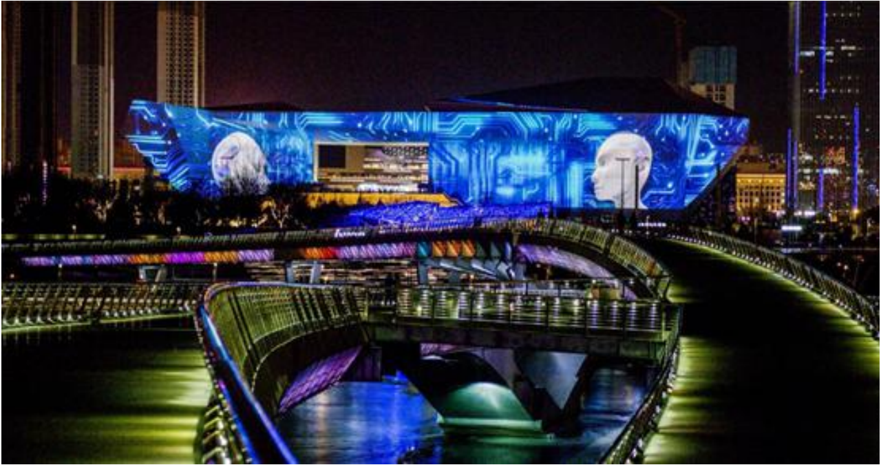
太原市长风商务区内河景观提升