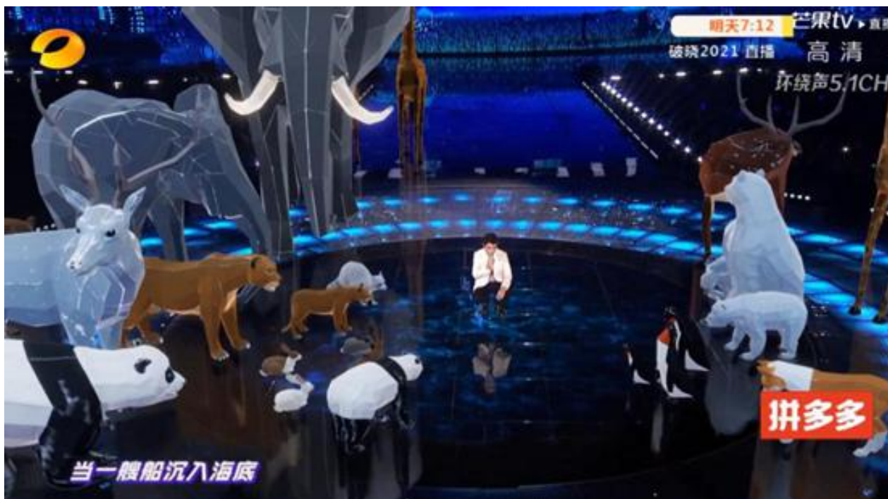
朱一龙节目的AR的交互直播效果