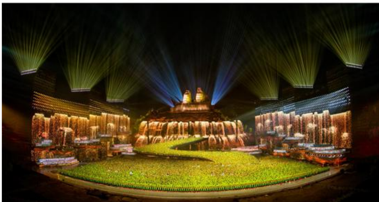
2020年央视春晚郑州分会场

报告期内公司实现营业收入12,269.14万元。新冠疫情的爆发严重影响了大型活动文艺演出，报告期内仅有2020年央视春晚郑州分会场、央视春晚珠海分会场和2019全民K歌年度盛典颁奖晚会等大型活动，项目数量大幅减少。2020年2月中标的福建晋江第18届世界中学生运动会开闭幕式 and 2020年迪拜世博会中国馆主题灯光展演由于疫情原因，被迫延迟。