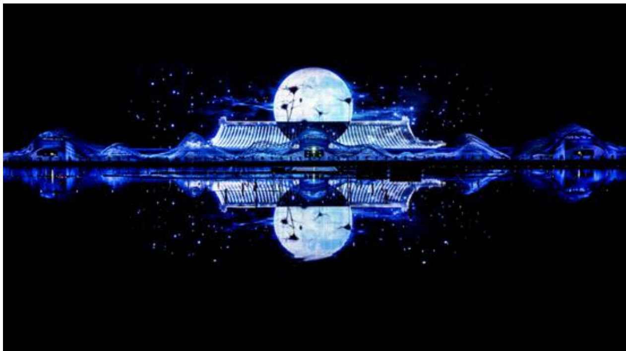
大型水上实景演出项目《如梦晋阳》

十一期间，公司承制的陕西西安大型水舞光影秀《大唐追梦》、陕西汉中大型文化史诗长歌《汉颂》和大型汉文化水上实景演艺《天汉传奇》、山西太原大型水上实景演出《如梦晋阳》、山东曲阜大型室内剧场演出《金声玉振》、江苏无锡灵山拈花湾禅意小镇禅文化体验和四川达州大型巴文化情景史诗剧《梦回巴国》等常规运营类项目引来无数游人，这些项目不仅展现出国内文旅市场的生机与活力，也体现了公司近年来在文化旅游演艺项目的品质。2020年11月5日，2020中国旅游演艺大会评选了“2019年中国实景旅游演艺十强”和“2020年疫后旅游演艺复演先锋”，公司承制的《最忆是杭州》和《大唐追梦》分别入围。