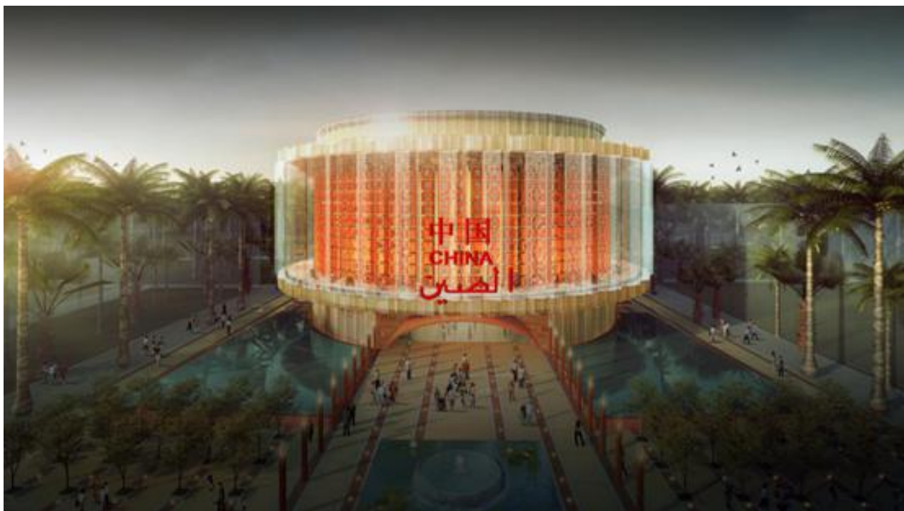
2020年迪拜世博会中国馆效果图

面对上述严峻形势，公司在借助国家级大型文艺演出市场经验基础，积极拓展商业演出市场。由公司承接的湖南卫视2020-2021跨年演唱会已圆满落幕，收视六网全域第一。此次跨年演唱会是公司与中国湖南卫视的首次合作，也是首次完全由中国团队全程参与的创意之作，展示中国舞美的新兴力量。