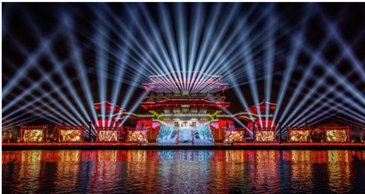
西安大型水舞光影秀《大唐追梦》

十一期间，公司承制的陕西西安大型水舞光影秀《大唐追梦》、陕西汉中大型文化史诗长歌《汉颂》和大型汉文化水上实景演艺《天汉传奇》、山西太原大型水上实景演出《如梦晋阳》、山东曲阜大型室内剧场演出《金声玉振》、江苏无锡灵山拈花湾禅意小镇禅文化体验和四川达州大型巴文化情景史诗剧《梦回巴国》等常规运营类项目引来无数游人，这些项目不仅展现出国内文旅市场的生机与活力，也体现了公司近年来在文化旅游演艺项目的品质。2020年11月5日，2020中国旅游演艺大会评选了“2019年中国实景旅游演艺十强”和“2020年疫后旅游演艺复演先锋”，公司承制的《最忆是杭州》和《大唐追梦》分别入围。