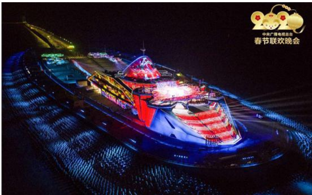
2020年央视春晚珠海分会场