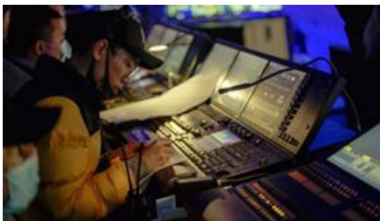
灯光总设计王邢磊