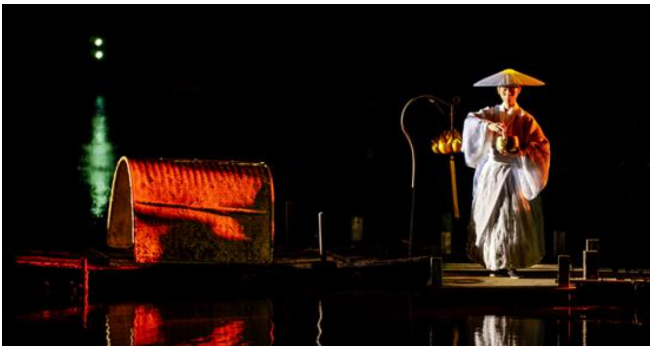
江苏无锡灵山拈花湾禅意小镇禅文化体验

在2019年郑州第十一届少数民族运动会和2020年央视春晚郑州分会场等大型文艺演出圆满成功的基础上，2020年4月，郑州锋尚世纪文化旅游发展有限公司的成立，标志着公司准备进一步深耕河南文化旅游演艺市场。2020年7月成立郑州黄河颂演艺有限公司，更迈出了涉足文化旅游演艺商业运营的第一步。