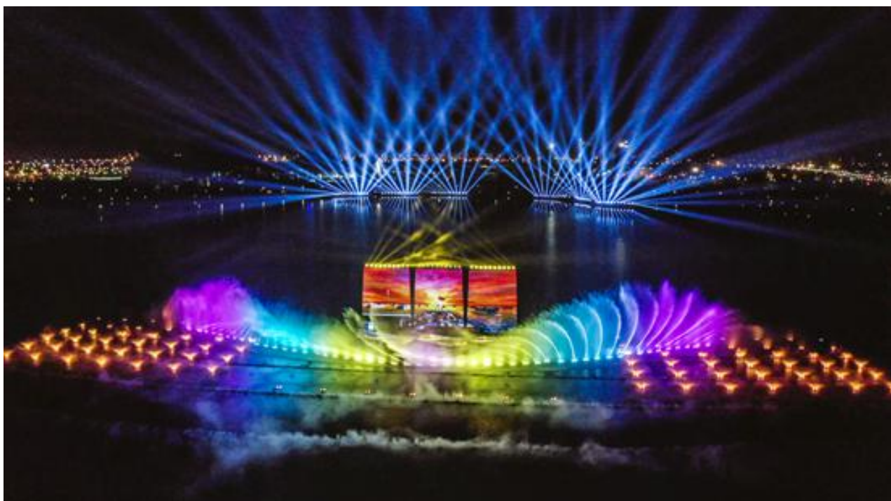
南通市紫琅公园紫琅湖光影水秀