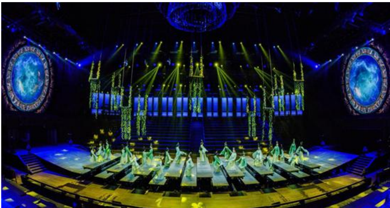
山东曲阜大型室内剧场演出《金声玉振》