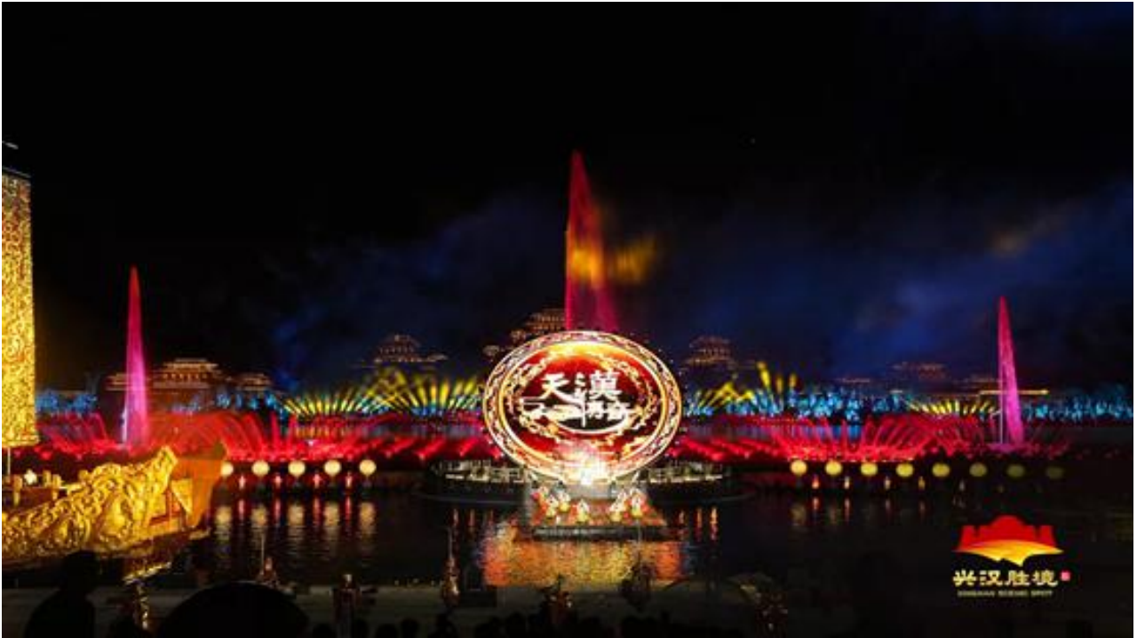
大型汉文化水上实景演艺《天汉传奇》