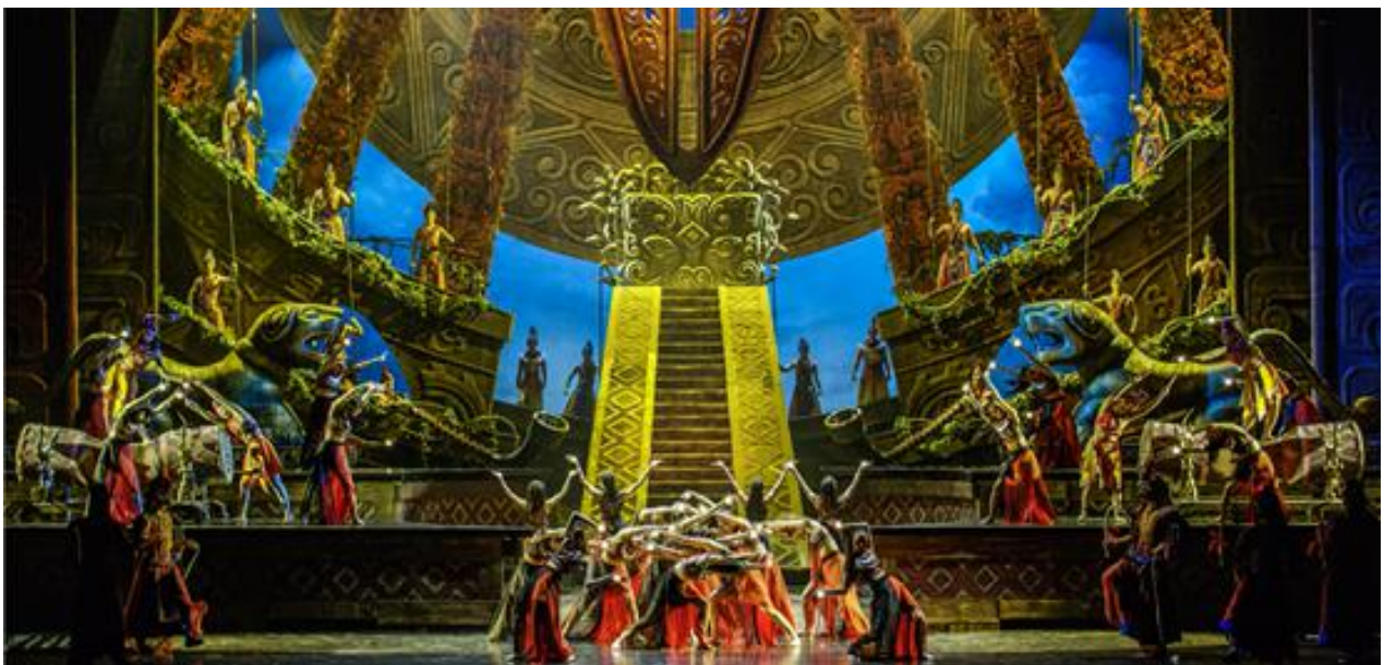
大型情景史诗剧《梦回巴国》