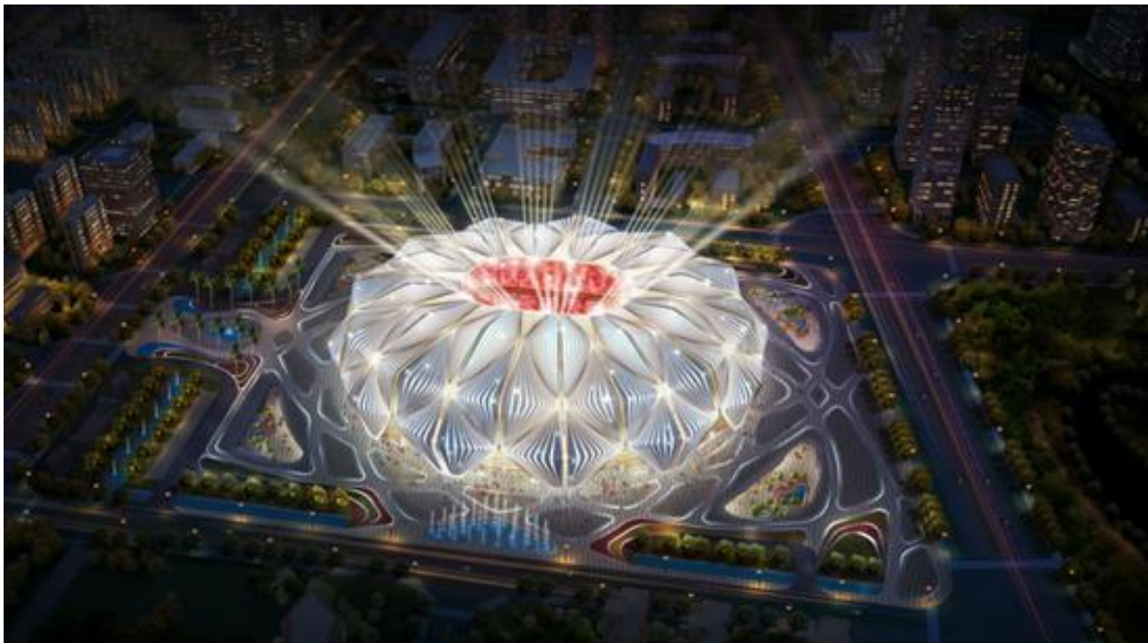
恒大集团广州足球场灯光秀效果图

报告期内实现营业收入19,083.68万元，比去年同期增长13.38%，占主营业务收入比重从18.54%提高到19.40%，保持了稳定增长。报告期内公司完成了太原市长风商务区内河景观提升、南通市紫琅公园紫琅湖光影水秀和恒大集团广州足球场灯光秀等项目。