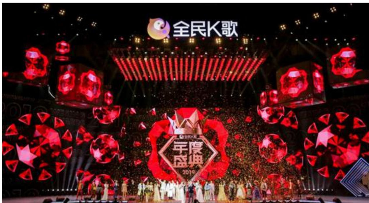
2019全民K歌年度盛典颁奖晚会